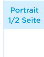
Portrait 1/2 Seite

Format: 210 x 280 mm Satzspiegel: 190 x 230 mm 1.670,- Euro