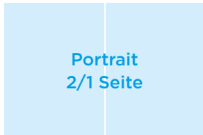
Portrait 2/1 Seite

Format: 210 x 140 mm Satzspiegel: 190 x 110 mm 970,- Euro