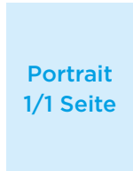
Portrait 1/1 Seite

Format: 210 x 280 mm Satzspiegel: 190 x 230 mm 1.670,- Euro